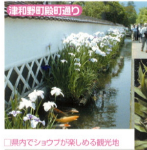
津和野町殿町通り ○鹿ヶ集本陣しょうぶ園(出雲市西林木町465) 問い合わせ:TEL0853-21-5601

山陰の小京都といわれる津和野町は、町全体が日本情緒たっぷり。その中でも最も城下町の面影を残すのが殿町通りで、散策する人が多い人気の観光スポットです。武家屋敷や白壁の旧家が建ち並ぶ通りを歩くと、色とりどりの鯉が優雅に泳ぐ姿を見ることができ、例年6月中旬頃になると約3千本のハナショウブが彩りを添え、しっとりとした和の佇まいに心癒されます。この時季の味覚の代表は、高津川の清流で捕れる香魚といわれるほど香り高い鮎。割烹「美加登屋」では、さまざまな鮎料理を堪能することができます。